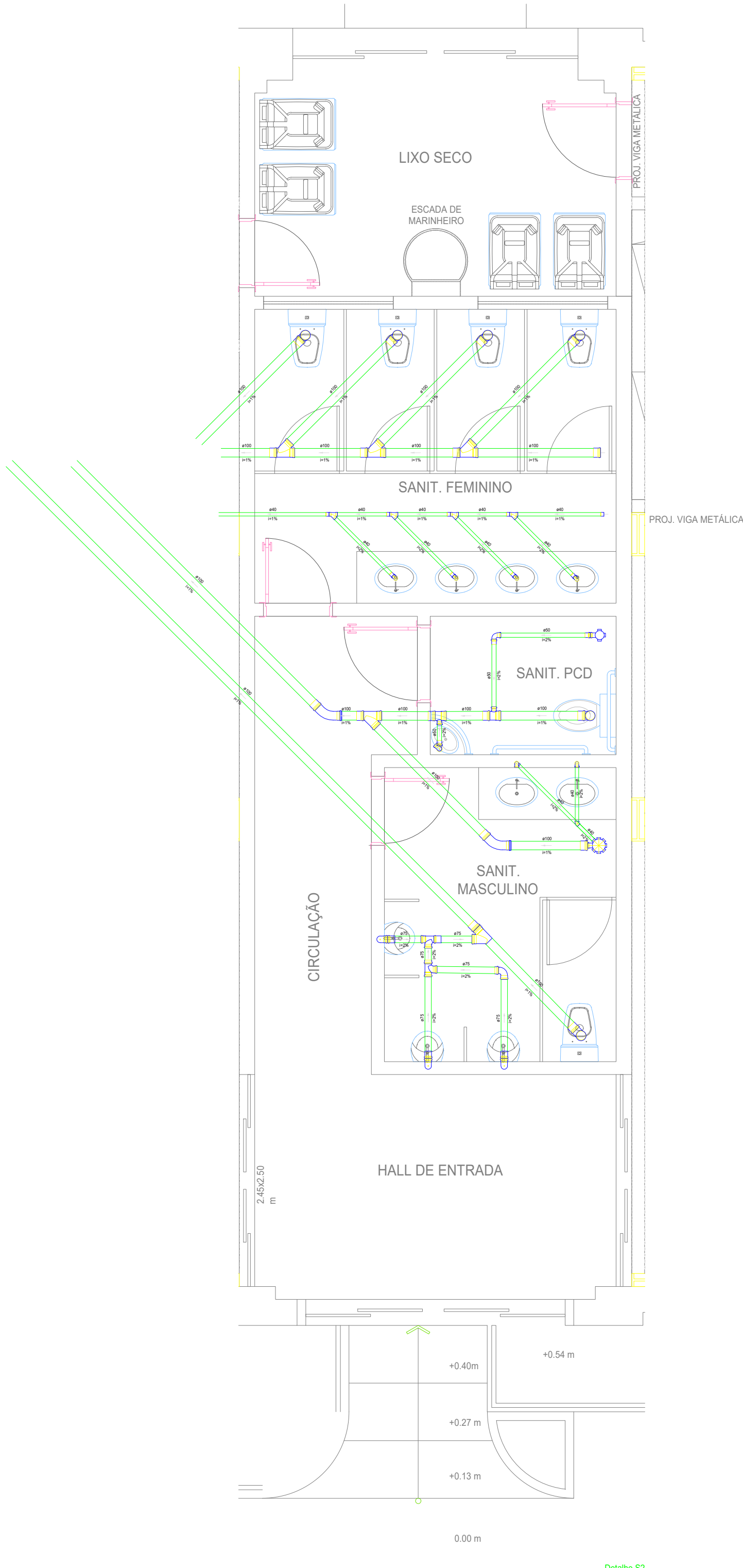
1 PLANTA BAIXA - LAYOUT ESC.: 1/75